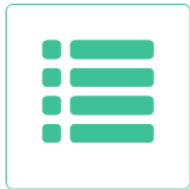
Listino Listino prezzi

Nella schermata iniziale con l'icona "Listino" visualizzi la lista dei prodotti che sono inseriti in magazzino. (Si chiama listino prezzi ma non ci sono i prezzi.)